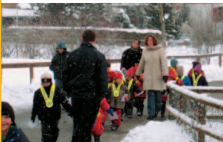
Whole school walkathon to raise money.