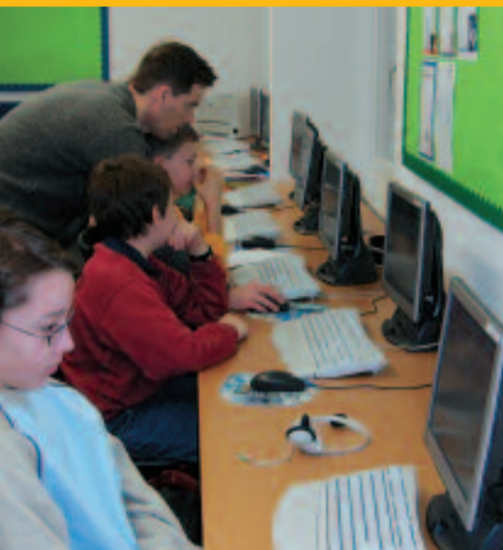
Der Computer-Raum wurde vergrößert und mit neuer Hard- und Software ausgerüstet.

Die ISR hat ein neues, modernes Wissenschaftslabor für die mittlere und höhere Schulstufe eingerichtet.