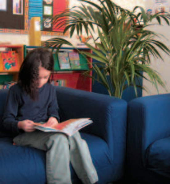
Leseratten kommen in der erweiterten Bibliothek auf ihre Rechnung.