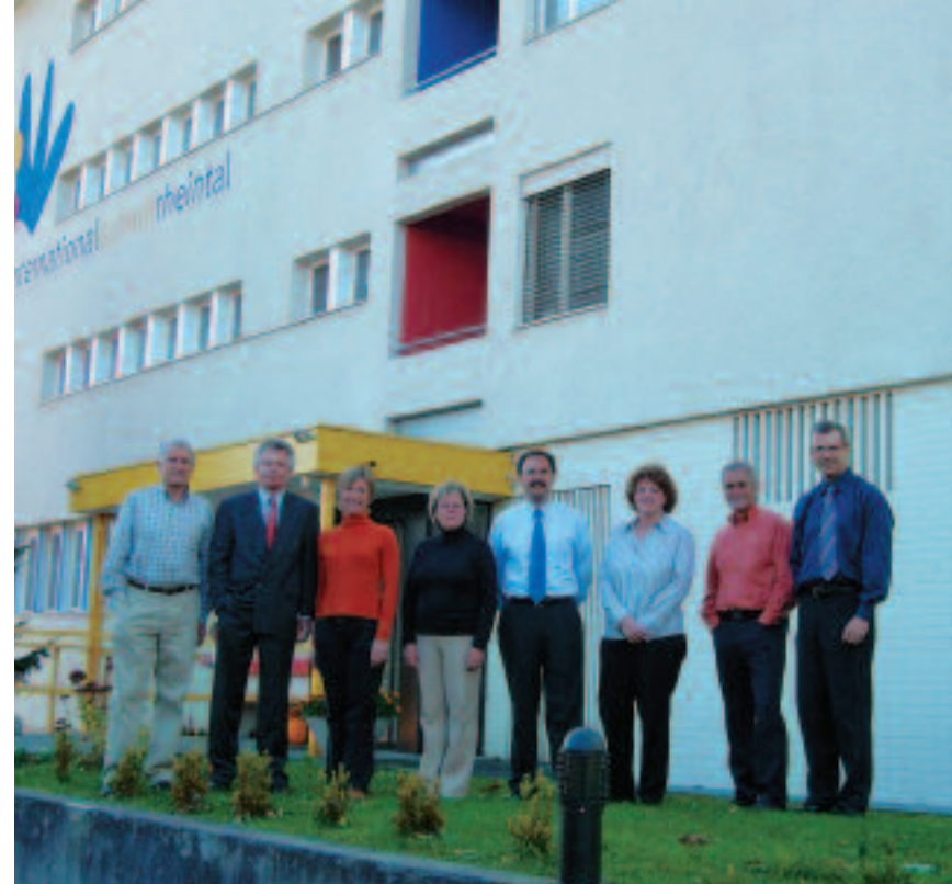
The members of the board.